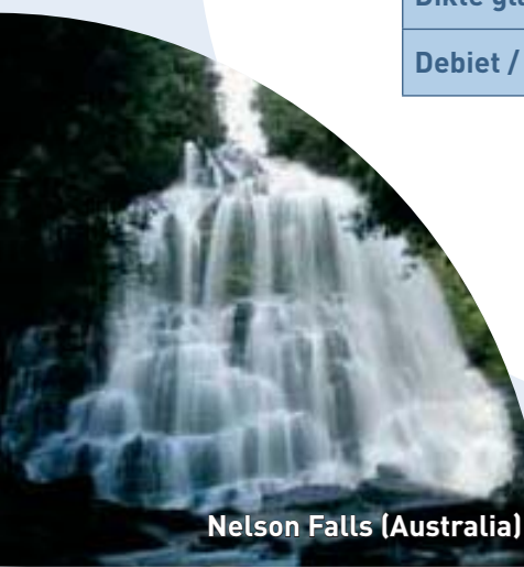
Nelson Falls (Australia)

Vraag de prijzen aan uw verkoper Demandez les prix à votre vendeur